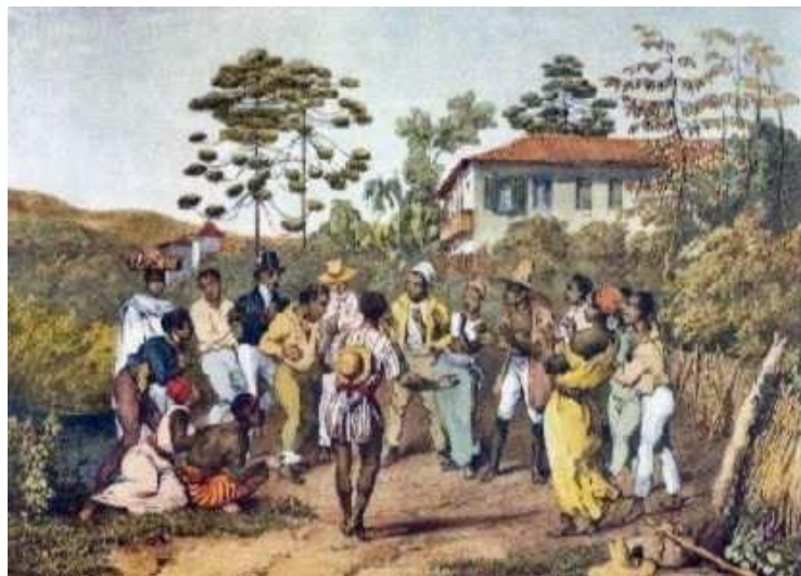
Fig. 3 Batuque , de Rugendas.