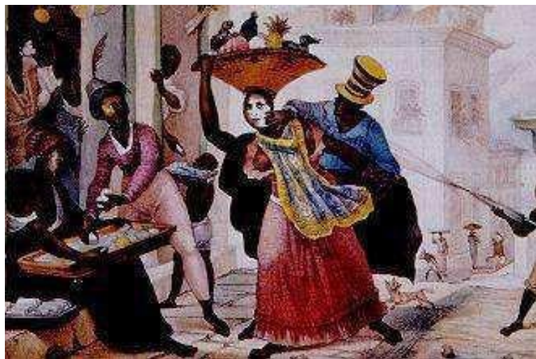
Fig. 7 Carnaval , de Debret (ca. 1820-30).

Nas ilustrações acima, em meio do cenário de um cotidiano de trabalhos, os sujeitos permeiam os espaços entre aqueles que transitam. São mulheres com cestas na cabeças e mãos nos quadris que constituem a cena em que se delineiam um misto de linguagens corporais típicas entre os que dançam,