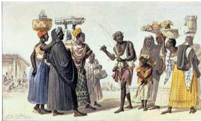
Fig. 6 Tocador de Urucungo , de Rugendas.

Além disso, percebe-se nas duas imagens a interação existente entre os integrantes das respectivas cenas, em meio a batucadas e movimentos corporais que formam um conjunto de diálogos em gestos. Também é possível perceber tais traços de similaridades na representação da capoeira de Rugendas e o tocador de Urucungo de Debret: